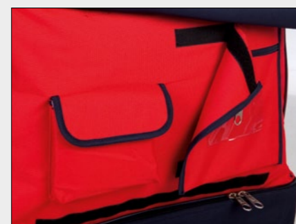
Tasca staccabile Detachable pocket · Poche détachable Entfernbare tasche · Bolsillo separable