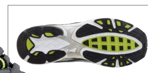
Tabella Comparativa · Comparative Table · Tableau Comparatif · Zwischenboden · Cuadro Comparativo